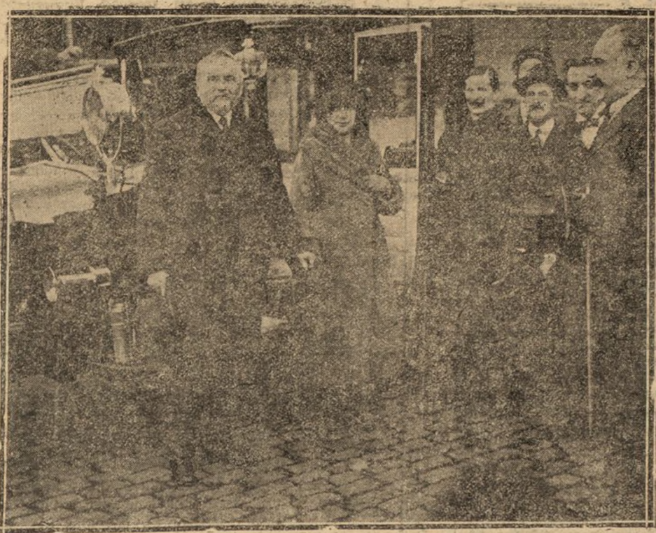
EL PRESIDENTE DE LA CONFERENCIA, M. HANNOTAUX, Y SU SEÑORA

Una vez cometido el delito, y libres de todo peligro de detención, simulando que la «moto» estaba estropeada, o de acuerdo con los dueños del local donde la ocultar,