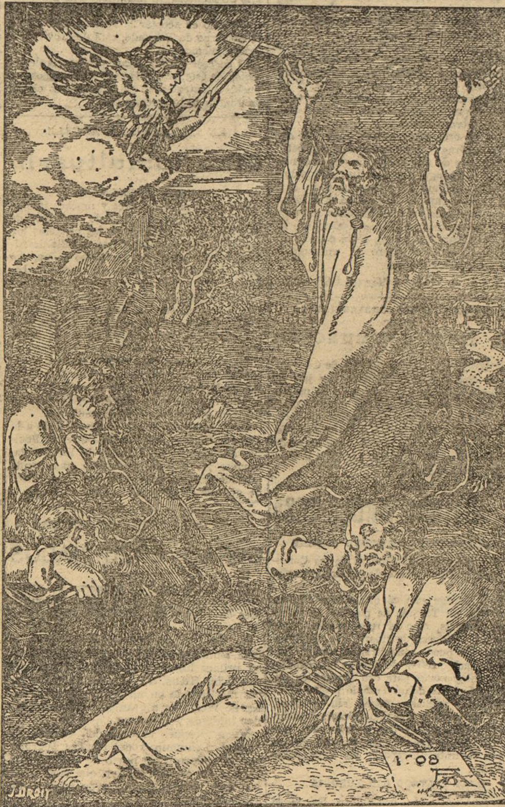
LA ORACION DEL HUERTO, por Alberto Durero, siglo XVI.