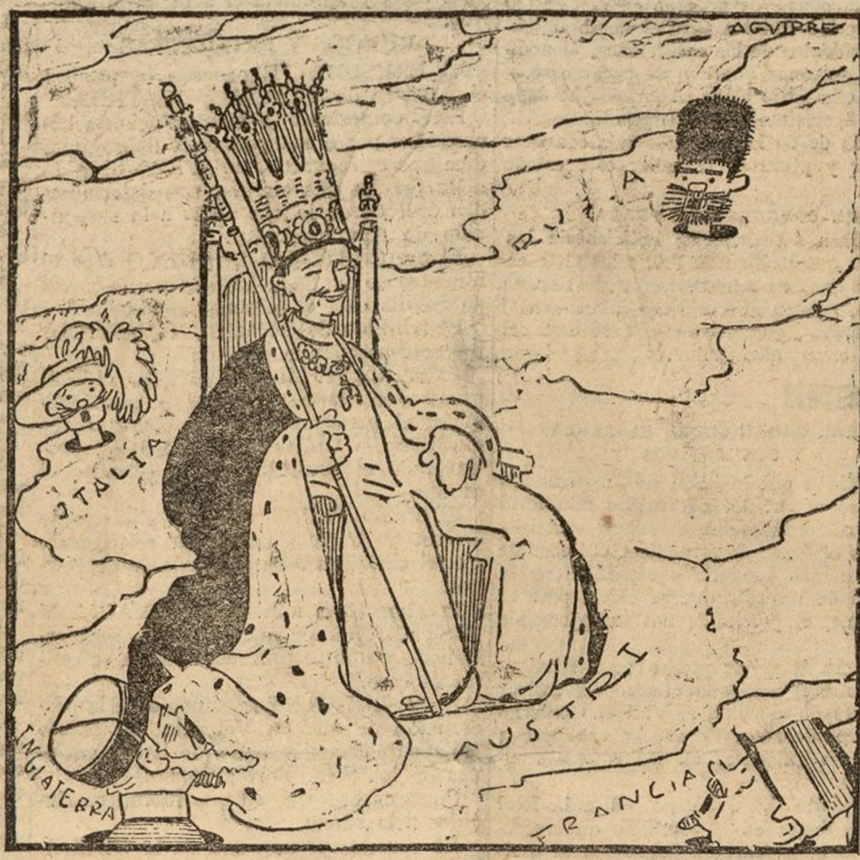
¡Y DECÍAN QUE LAS «CORONAS» ESTABAN POR EL SUELO!