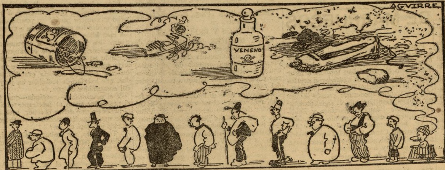
Proyecto de nuevas bases para el futuro contrato.