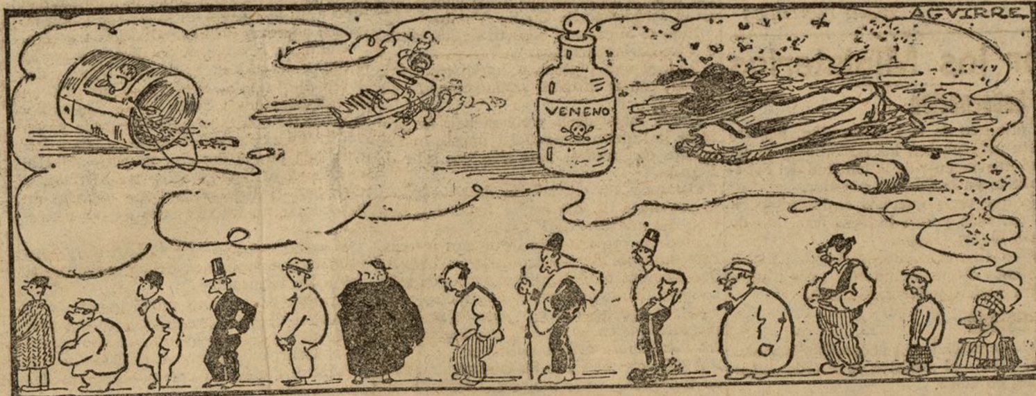
Proyecto de nuevas bases para el futuro contrato.