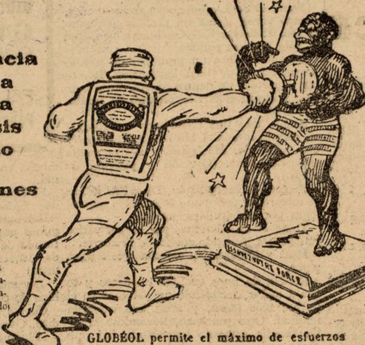
GLOBEOL permite el máximo de esfuerzos

Comunicación a la Academia de Medicina de París el 7 de Junio 1916 Etablissements Chatelet 2, rue de Valenciennes, Pa- ris.—Succursales en España: Pa- seo de Gracia, 48, Apartado 718, Barcelona. Escribir la marca registrada: EL HOMBRE DE LAS TENAZAS.