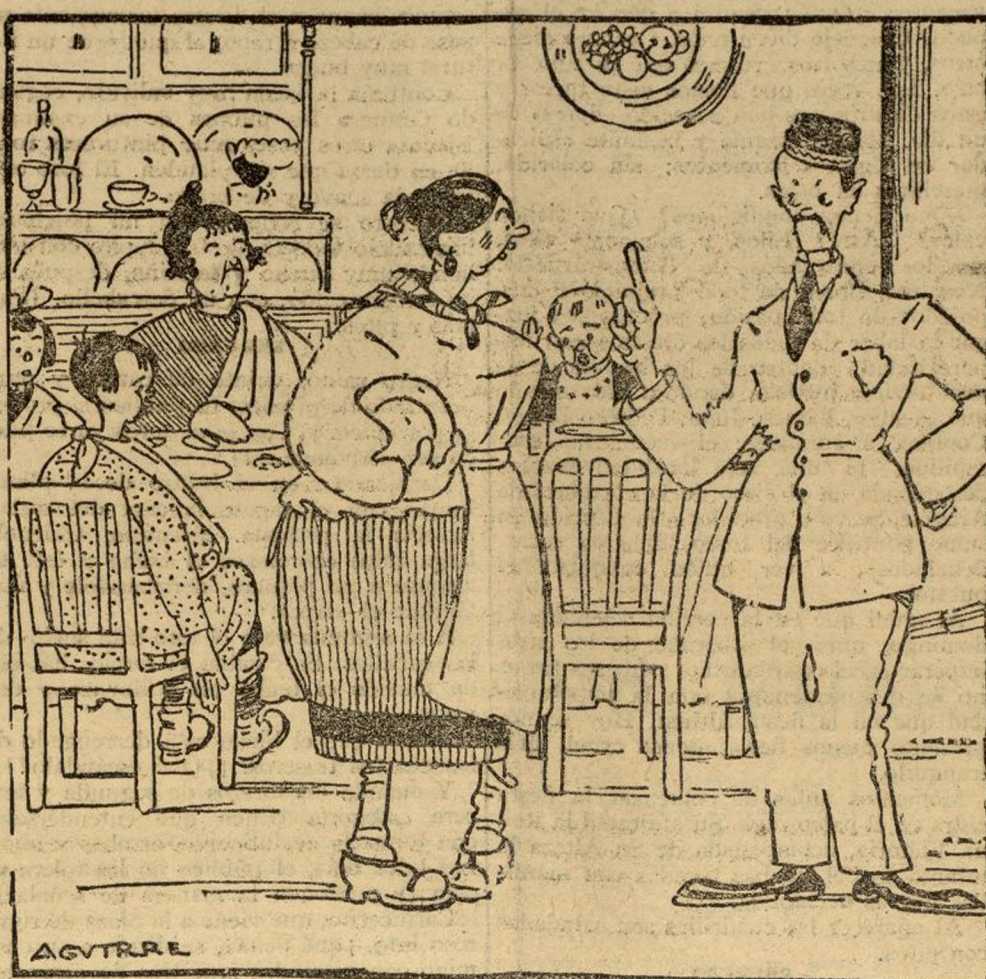
—Y DILE A TU NOVIO QUE TE ENSEÑE LOS TOQUES DE TROMPETA, PORQUE DESDE EL MES QUE VIENE, AQUÍ SE HA DE HACER TODO CON ARREGLO A LA ORDENANZA