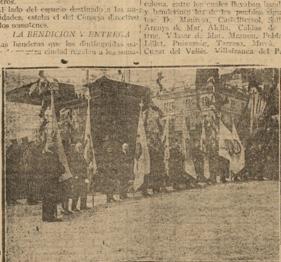
LAS BANDERAS DE LOS DISTritos, QUE LAS SEÑORAS REGALAN A LOS SOMATENES

Las banderas que las distinguidas autoridades de esta ciudad regalan a los somatenes.