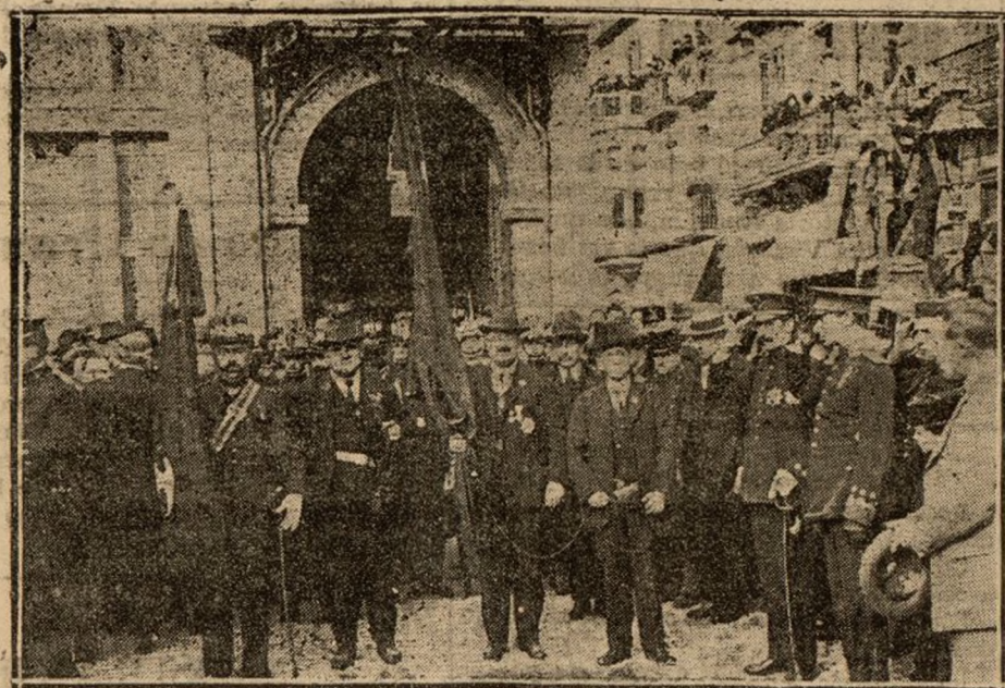
LLEGADA DE LA BANDERA DEL SANTO CRISTO DE IGUALADA

(De nuestro redactor especial en Barcelona)