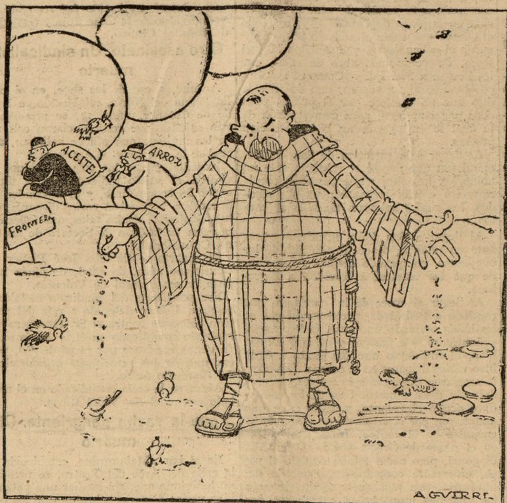
—HERMANOS PAJARILLOS! MIENTRAS YO OS CUIDO A VOSOTROS, OTROS PAJAROS DE CUENTA SE CUIDAN ELLOS MISMOS!

del tercer Congreso, que comenzará el próximo viernes.