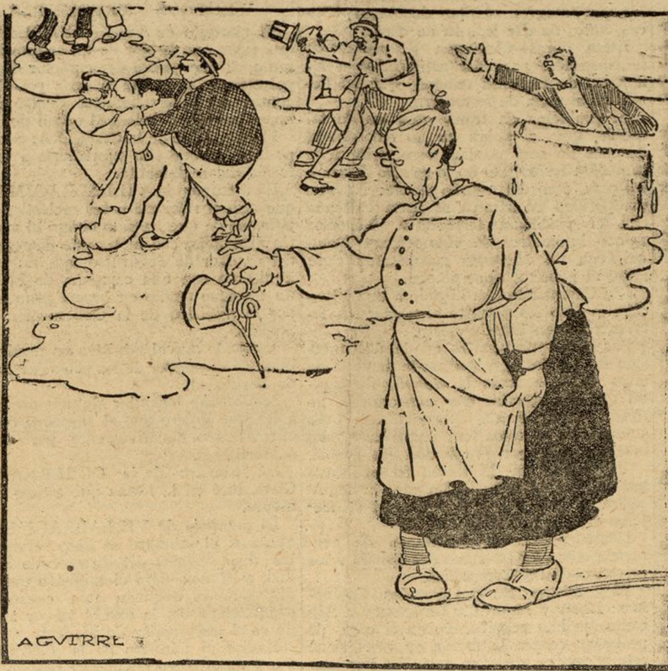
La balsa de aceite