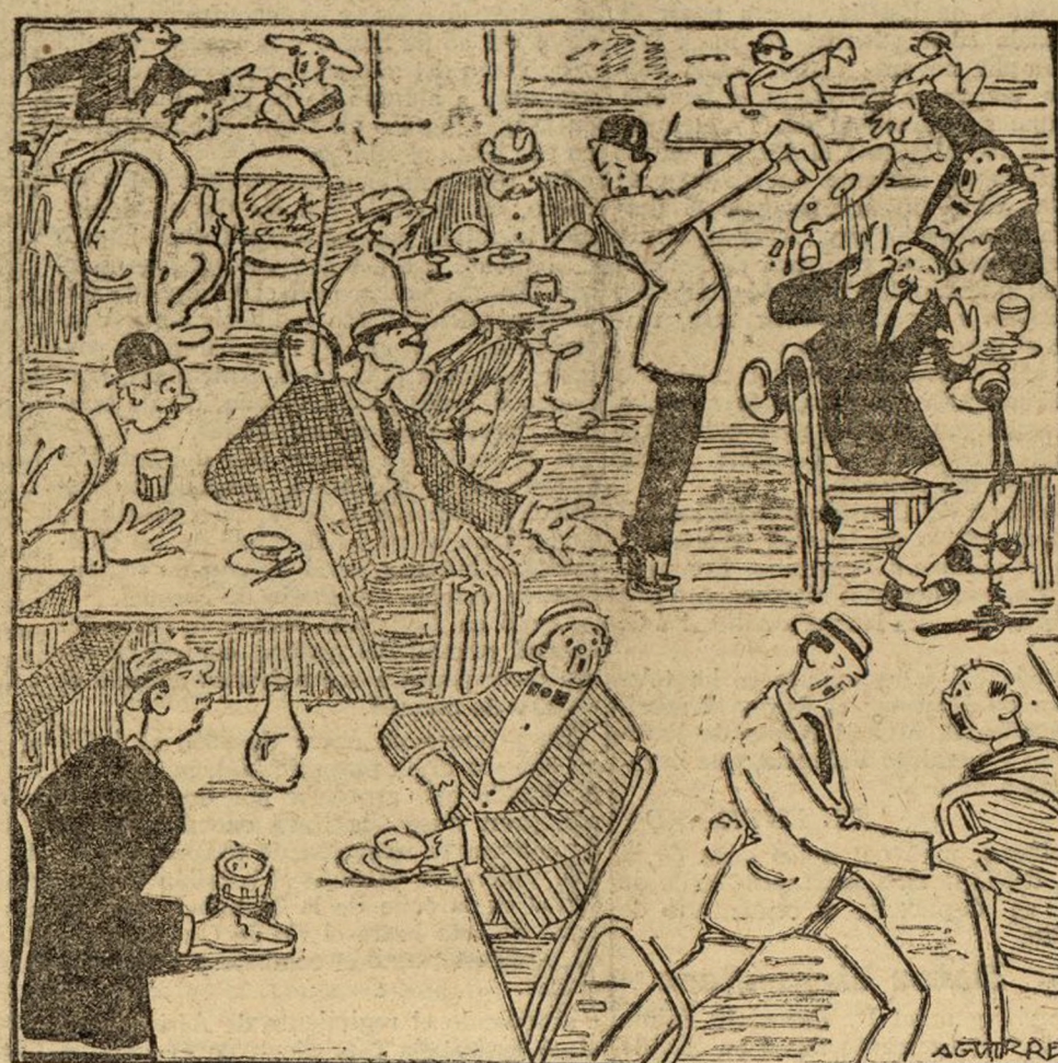
ASPECTO DE UN CAFE MADRILEÑO DESPUES DE UNA CORRIDA DE TOROS