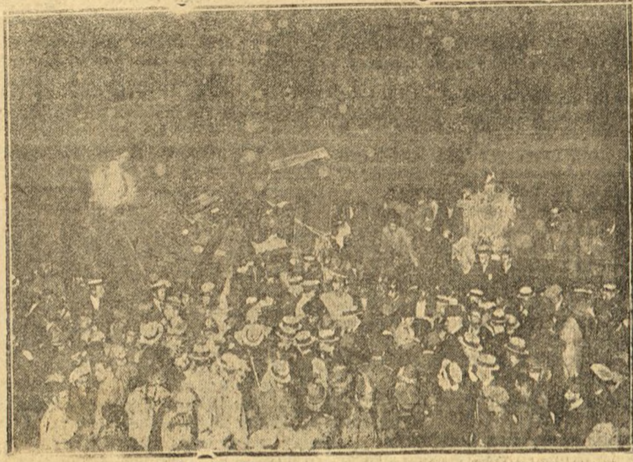
EL MINISTRO DE FOMENTO EN EL MOMENTO DE LLEGAR AL LUGAR DE LA CATÁSTROFE

Sin identificar: Un niño de catorce años, acaso hijo de la señora Americana antes citada, y un hombre que falleció en el hospital.