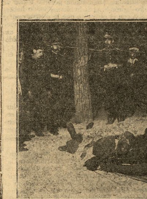
LOS PRIMEROS CADAVERES EXTRAIDOS DE DEBAJO DE LOS ESCOMBROS (104. Pto.)