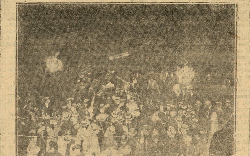
EL MINISTRO DE FOMENTO EN EL MOMENTO DE LLEGAR AL LUGAR DE LA CATÁSTROFE (104. Pto.)

Un identificador: Un niño de catorce años, acaso hijo de la señora americana antes citada, y un hombre que falleció en el hospital.