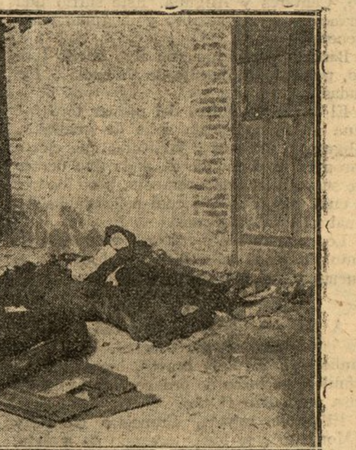
LOS PRIMEROS CADAVERES EXTRAIDOS DE DEBAJO DE LOS ESCOMBROS (104. Pto.)

Desde las once y media de la noche del sábado, los trabajos que se hicieron con