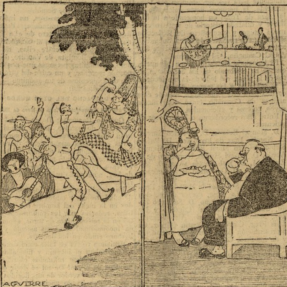
Las verbenas de antes.