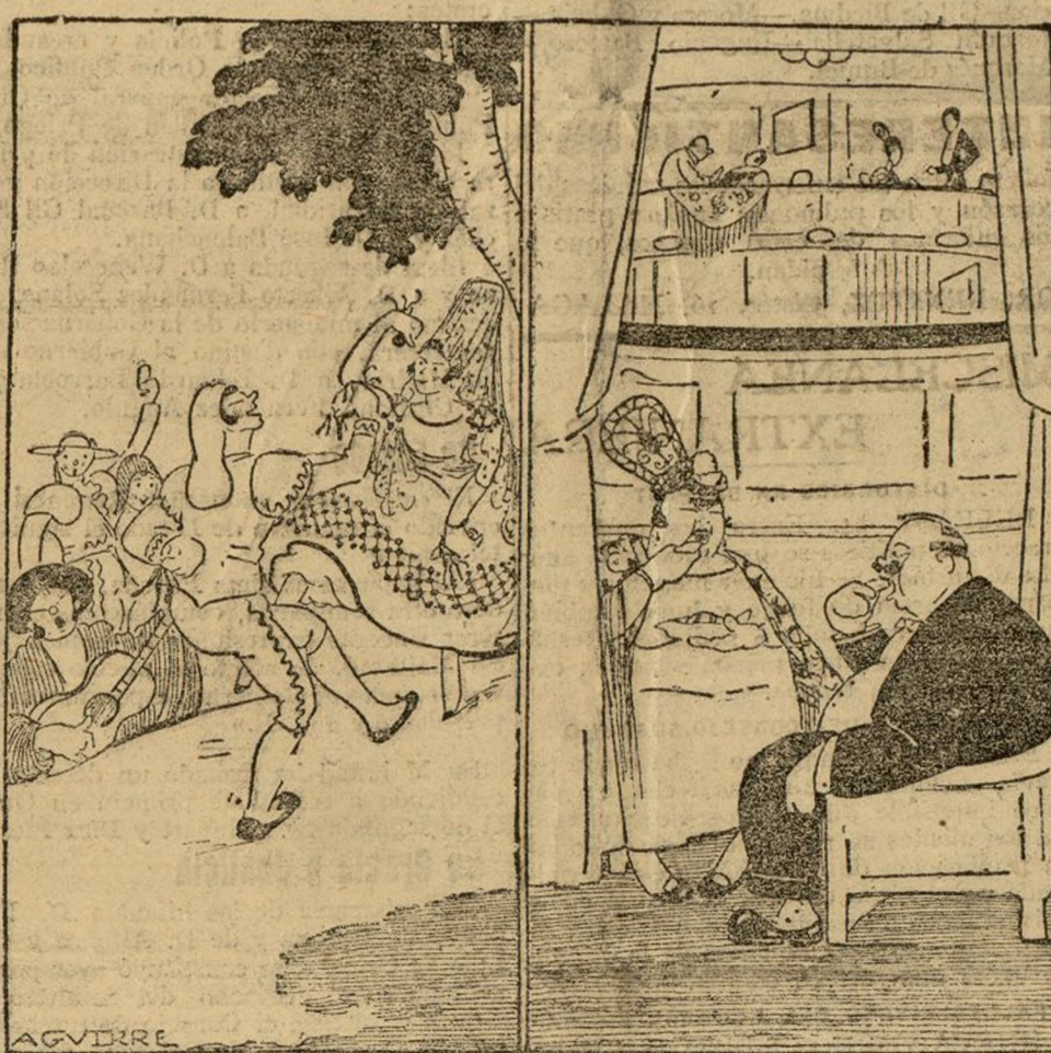
Las verbenas de antes.