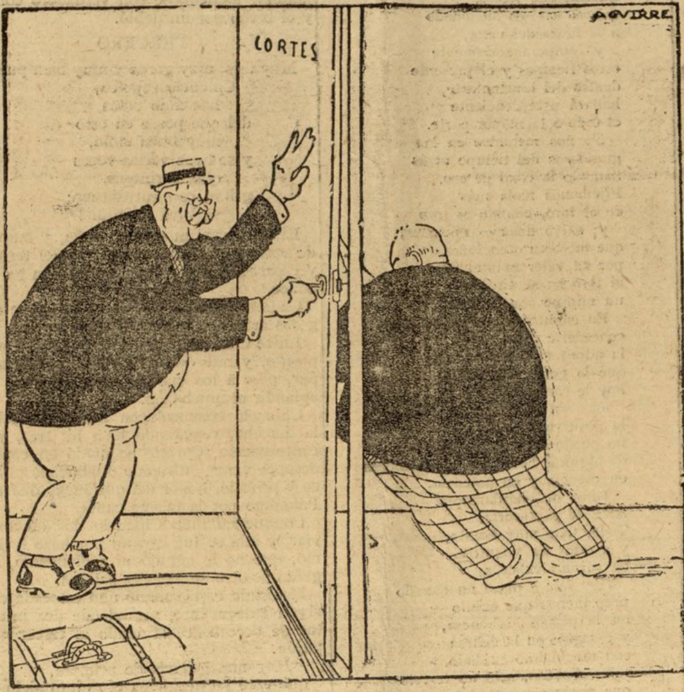
¿Quién podrá más?