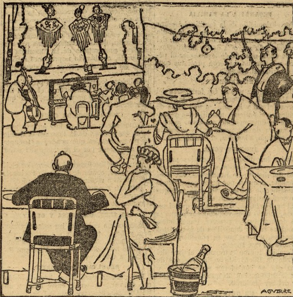
SE MULTIPLICAN DE MODO QUE ESTA ACOTADO EL CARTEL Y HABRA QUE APELAR MUY PRONTO A LAS CHULAS DE PAPEL