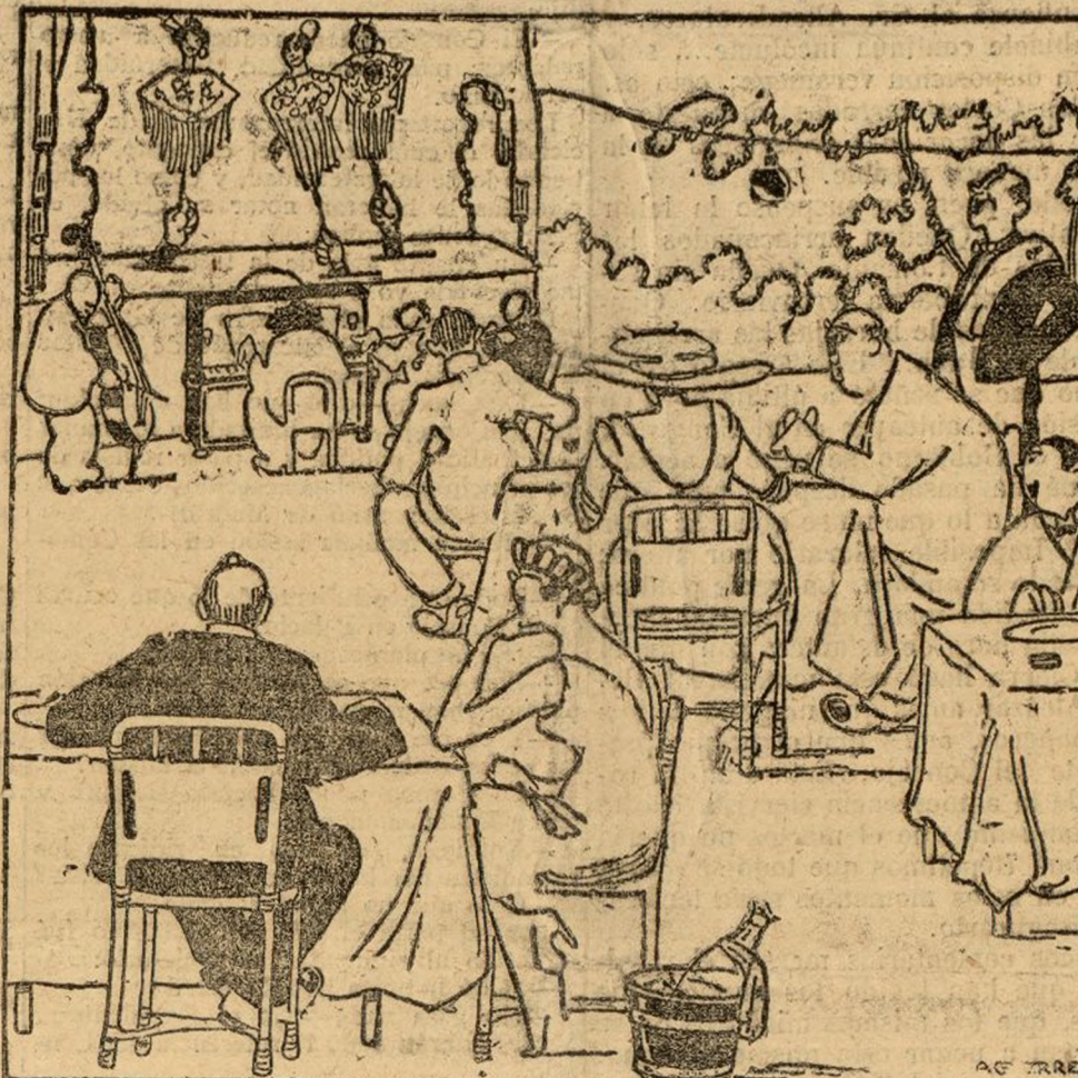
SE MULTIPLICAN DE MODO QUE ESTA AGOTADO EL CARTEL Y HABRA QUE APELAR MUY PRONTO A LAS CHULAS DE PAPEL

no se baña la gente humilde. Yo le pregunté a una criada a mi servicio que cuándo se bañaba, y me respondió que sólo en las ocasiones en que iba a su pueblo, porque el agua de Madrid le hacía daño al pelo. Las visitas de la familia a su pueblo ocurrían lo más pronto cada dos años, al decir de ella.