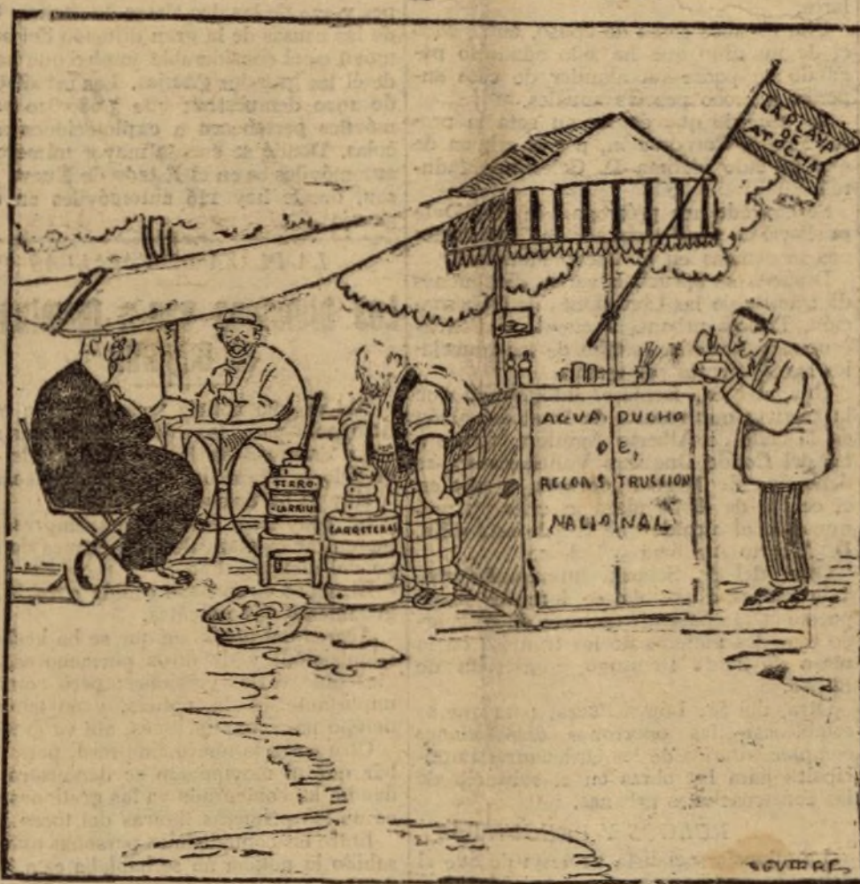
Cómo pasarán el verano los ministros