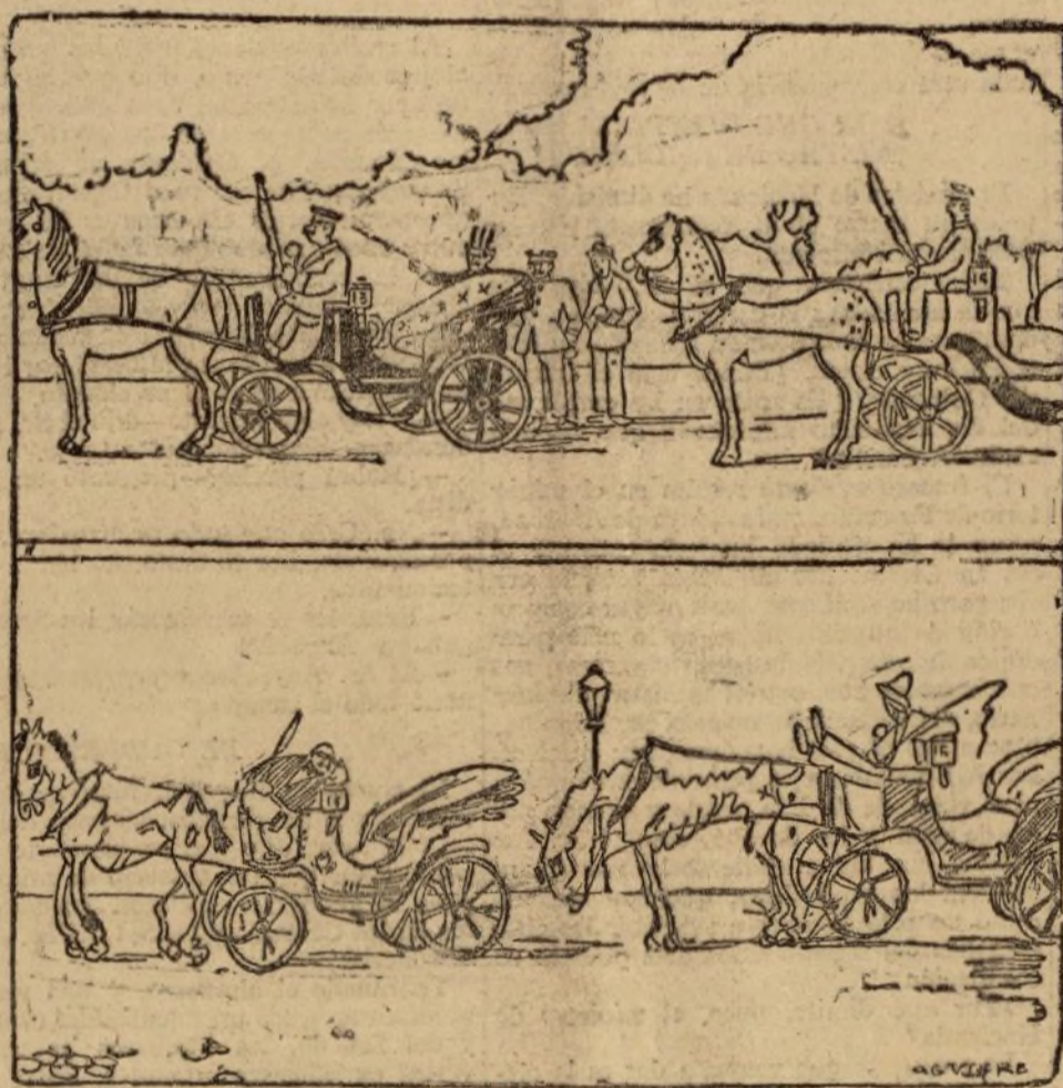
LOS DEMAS DIAS