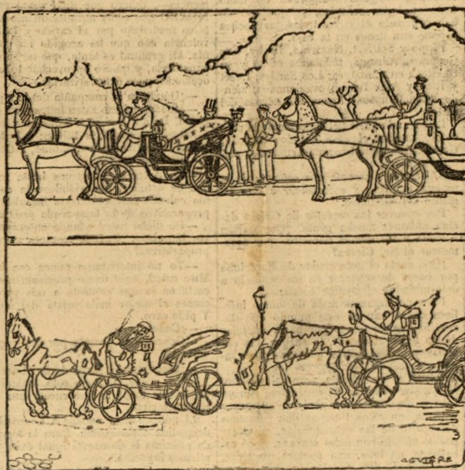
LOS DEMAS DIAS

co, los acudillados hoy por Sánchez Guerra y Bugallal, no quieren permanecer un momento más en el estatu quo político que desahaba el Sr. Cierva, y al cual, resignado y beatíficamente, se allanaba el señor Allendesalazar.