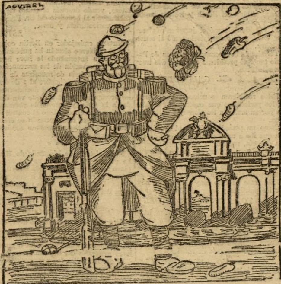
Homenajes al soldado desconocido