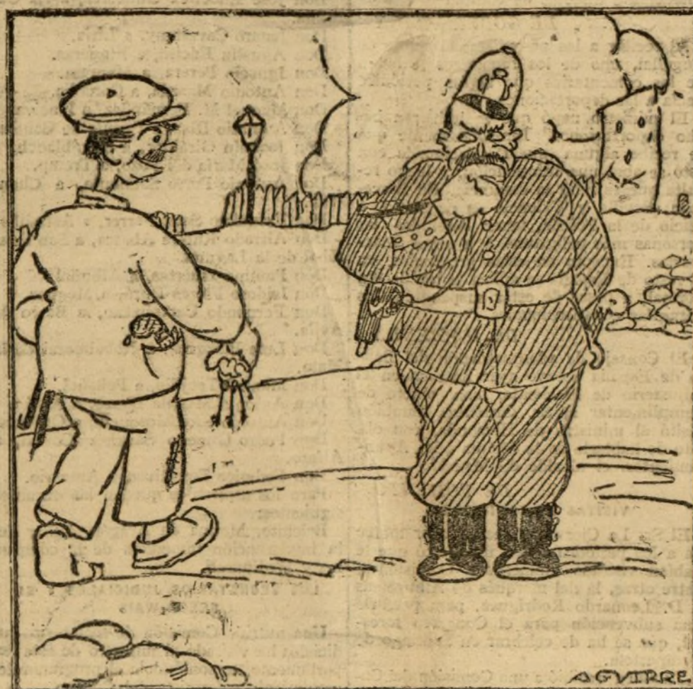
—ESTE SUJETO, SEÑAL DE LOS SINDICALISTAS Y DE LOS OTROS, HABRA QUE PRESENTARSE AL MINISTRO.