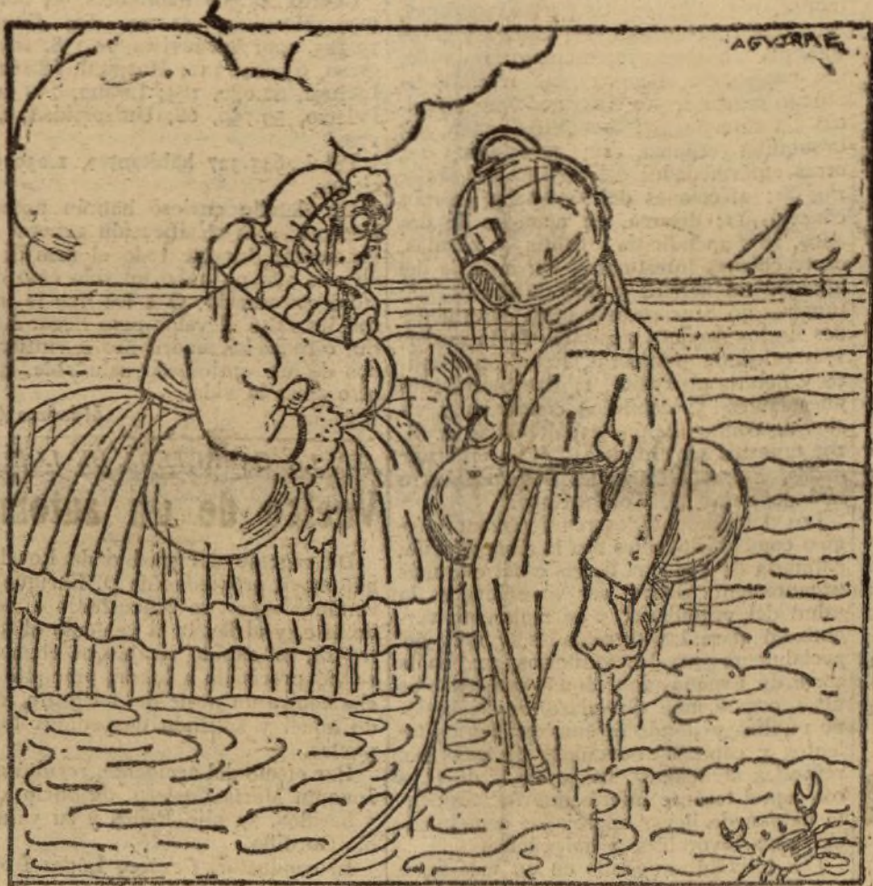
Figurines de baño para la presente estación