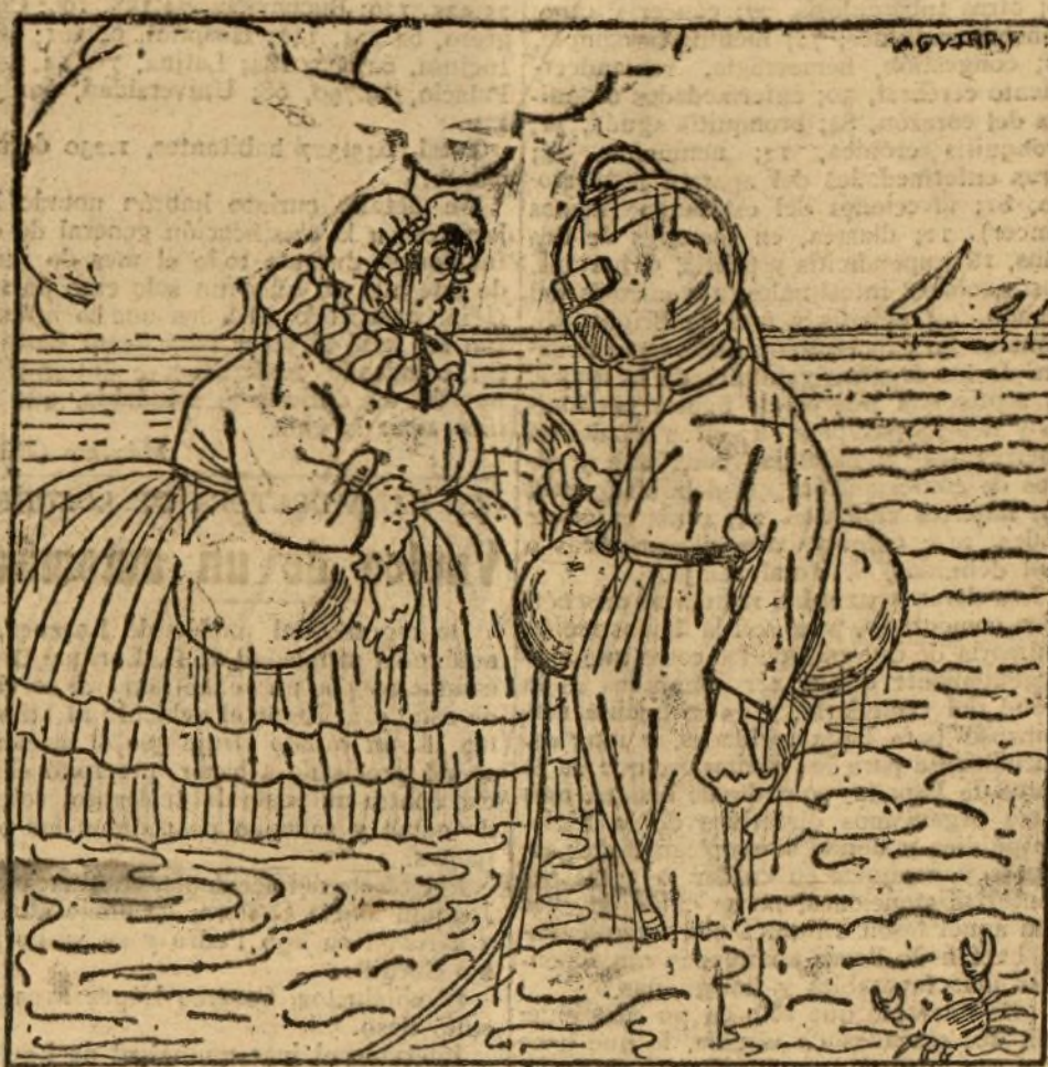
Figurines de baño para la presente estación

jeros de los tranvías que entre las numerosas personas que presenciaron el choque, dio lugar a que no se conociera la magnitud de la catástrofe.