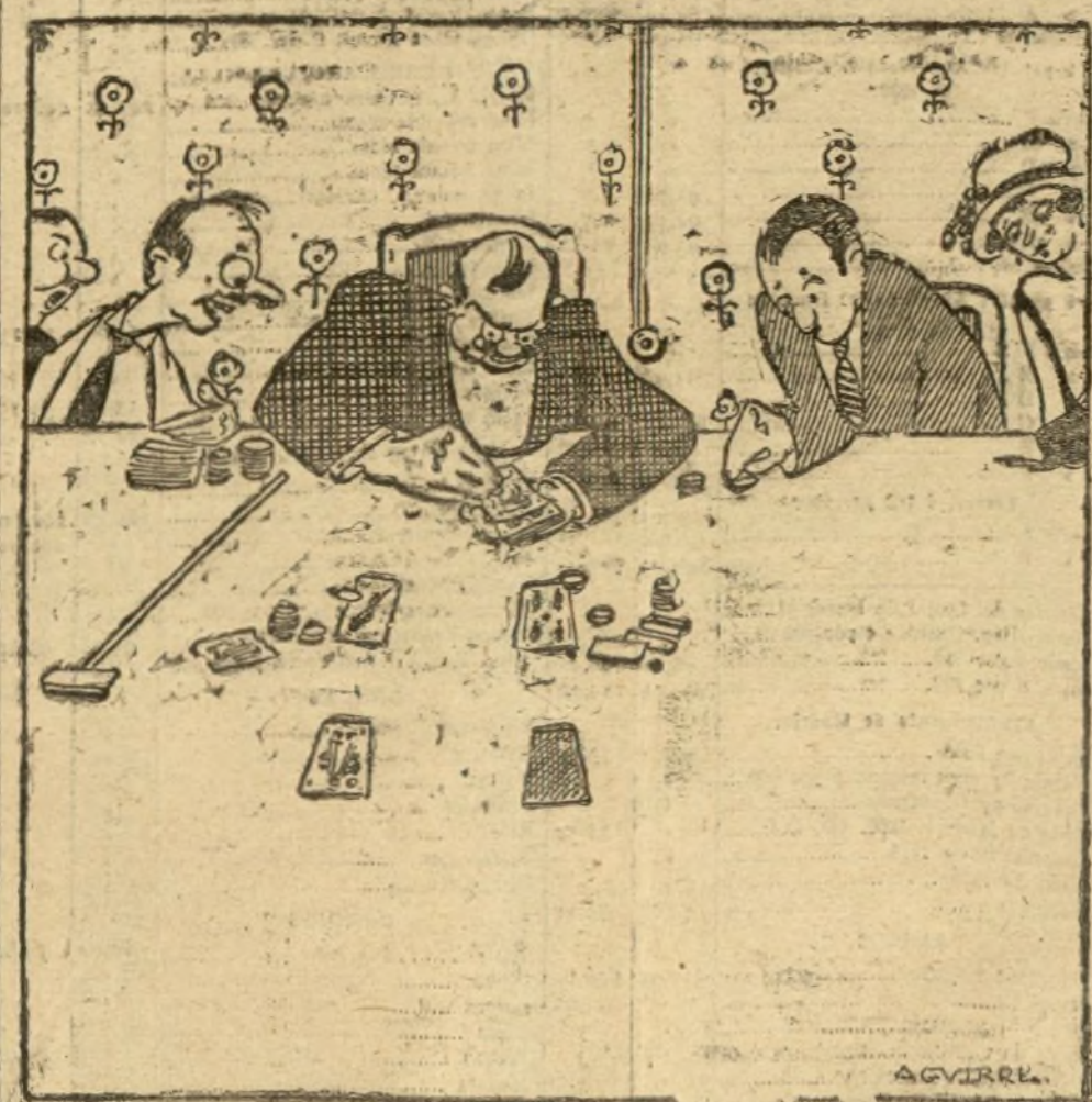
¿Pero no están prohibidas las líneas de "puntos"?