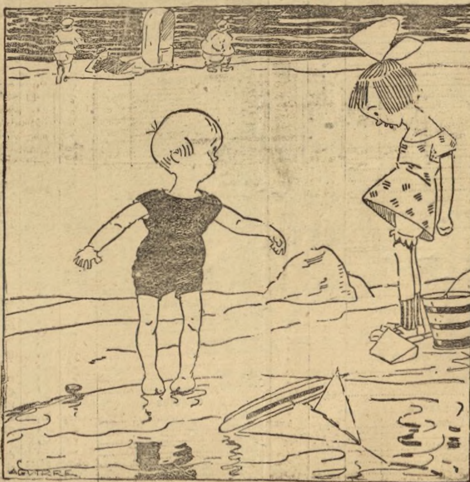
TE LLAMO PARA QUE ABRAS UNA BOCANA CON TU PALA, A VER SI PODEMOS SACAR ESTE BARRIL DE LA MAR CHICA