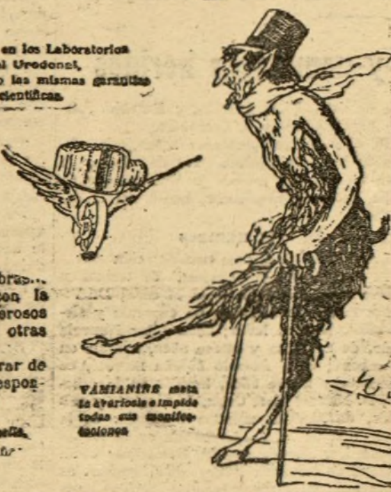
VAMIANINE mata la avariosis y impide toda su manifestación.

Exigir la marca depositada: EL HOMBRE DE LAS TENAZAS.