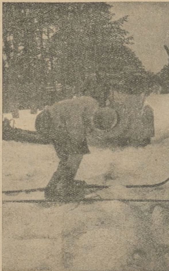
EL COCHE SE HA NEGADO A ANDAR Y NUESTRO CAMARADA CALVO SE DISPONE A HACER EL RECORRIDO EN SKIS