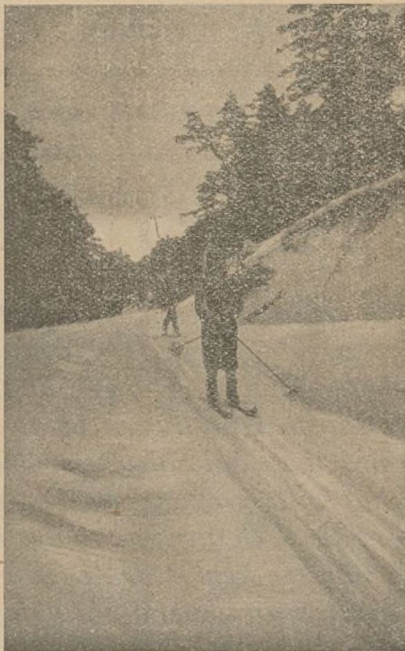
SOBRE LA NIEVE DE LA SIERRA SE DESLIZAN RÁPIDOS LOS ENLACES

La subida es pintoresca y agradable, a lo menos para mí que desconocía por completo aquellos lugares. Recorremos unos caminos estrechos entre arbustos y maleza, que se deslizan por el monte bajo. Después salimos a la carretera. Comienza la ascensión del Puerto de Navacerrada. Calvo me advierte que probablemente no vamos a poder hacer todo el recorrido en coche, porque el puerto «está cerrado», es decir, que la carretera está cubierta de nieve. Efectivamente, llega un momento en que el coche se niega a andar. Tenemos que apearnos y hacer el recorrido a pie. Es