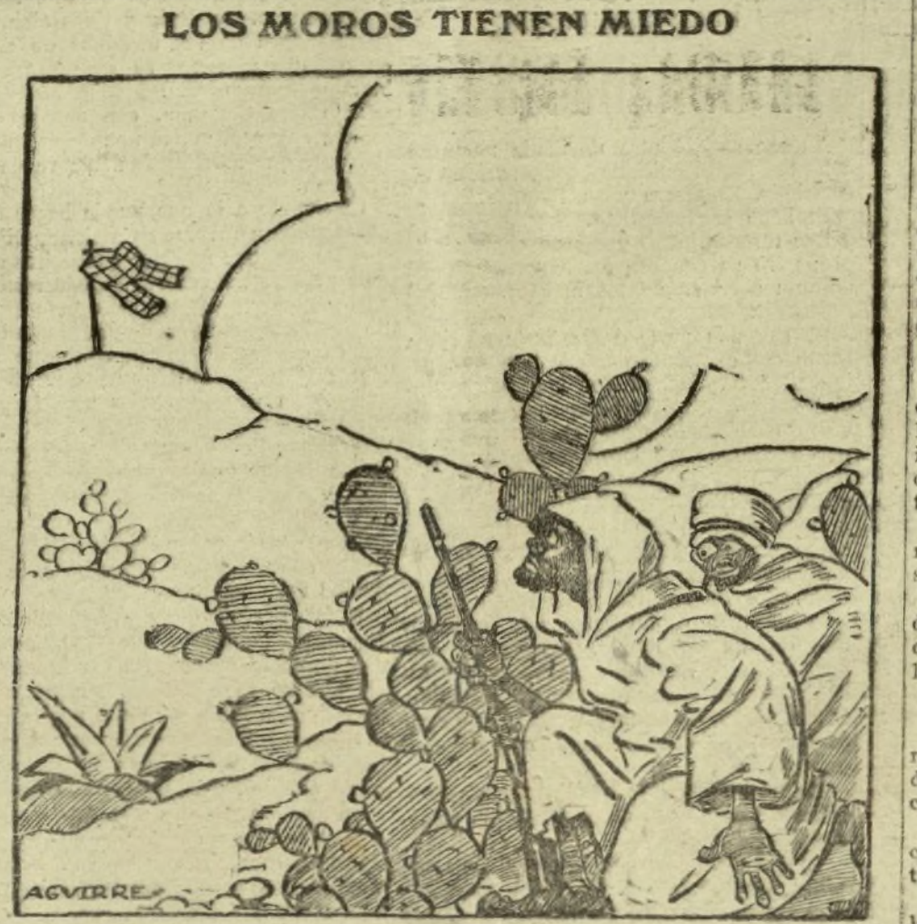
—OYE, «PACO», ¿QUE ESTAR AQUELLO? CUIDADO! ¡PODER SER UNA BOMBA DE GASES ASFIXIANTES!

Así, pues, el ferrocarril de Xauen se empezó a estudiar desde el primer momento, sin perjuicio de que se construyera pista férrea militar, como se hizo con gran presteza. Y en mi afán de facilitar al alto comisario todos los elementos que necesitaba para su acción, le ofrecí la suma prevista para esta obra, enviándole además datos, pre-