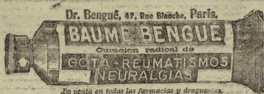
De venta en todas las farmacias y droguerías.