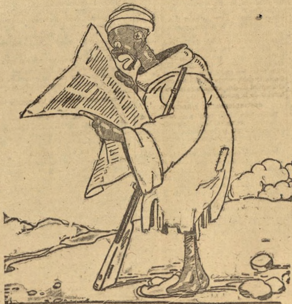
—Real-lahl. Otra vez la censura? Esto es una lástima de perra cordal