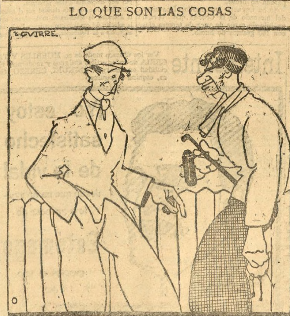
—Pero tú vas con esos útiles por mitad la calle? —Pero si es que estoy ahora empleado en el «susucio», regilando los Ayuntamiento de Madrid

Se ha recibido una comunicación interesando la busca de un local para 400 camas, en vista de haber sido designada Sevilla para