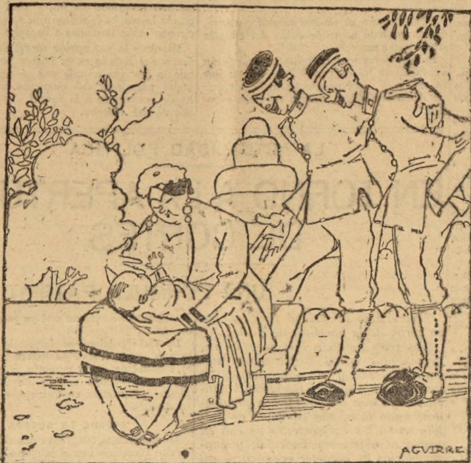
L'advertimos que aquí hay dos voluntarios.

Lo que más grabado llevo en la memoria de cosas acaecidas en la guerra europea, son los detalles insignificantes que rodaron un día por los hilos telegráficos o por las ondas, sin un comentario siquiera.