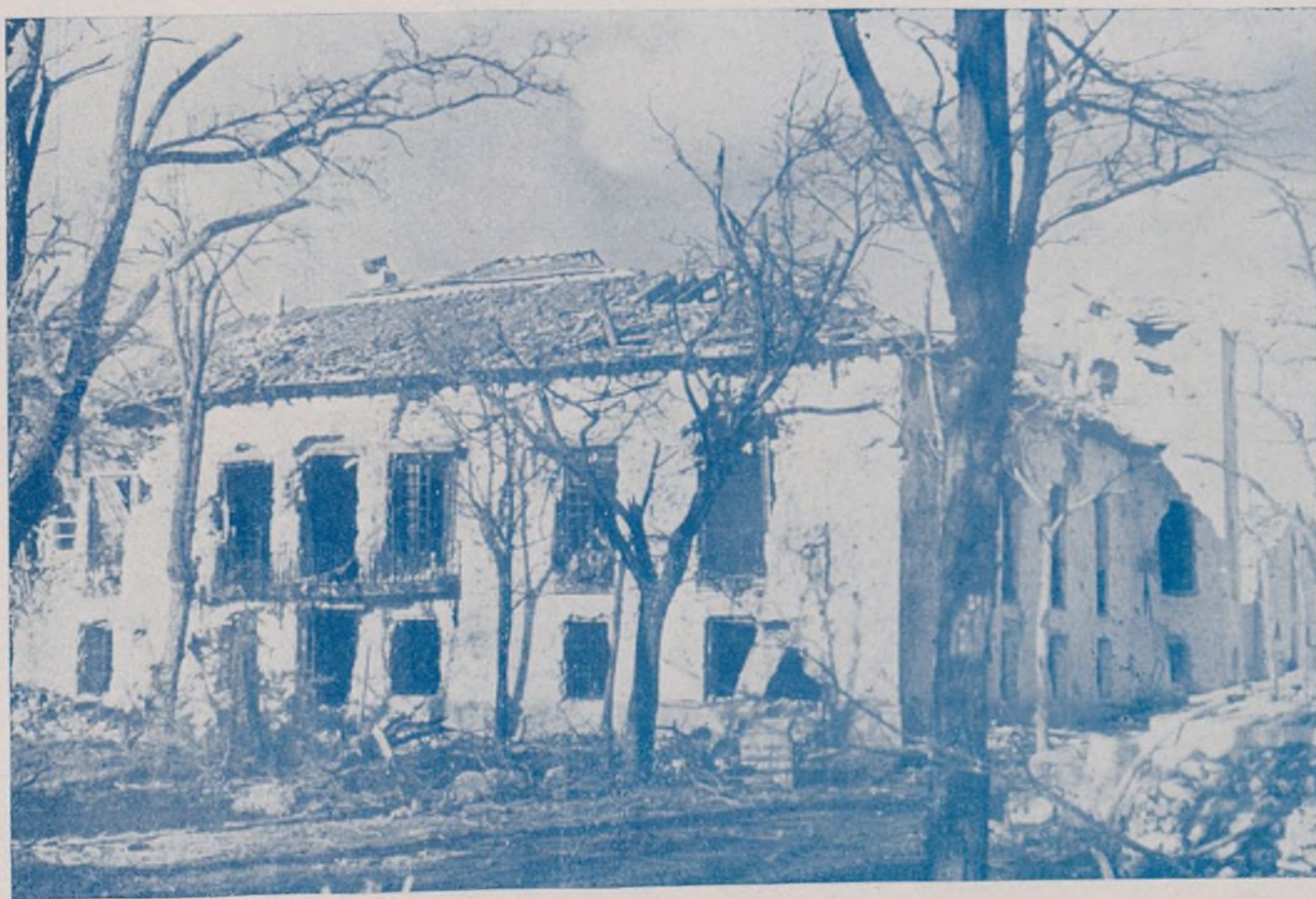
El palacio de Ibarra, poco despues de ser tomado por nuestros bravos soldados, eficazmente ayudados por los tanques,

1937 Que distinto matiz, ha tenido este 1.º de Mayo, a otros anteriores. En él no ha habido peticiones al Gobierno, porque, en estos momentos, todos formamos parte de él; no ha habido, manifestaciones, porque, desde hace unos meses, toda España, es una grandiosa manifestación; no se ha gritado «contra la guerra y el fascismo» porque hemos modificado la consigna, diciendo «contra el fascismo, por medio de la guerra,» y en el santuario de Sta. María de la Cabeza, en Bilbao y otros puntos se ha hecho honor a la fiesta del proletariado, causando grandes derrotas al enemigo. Y así ha transcurrido este 1.º de Mayo, diametralmente opuesto a todos los anteriores, pues las circunstancias nos han obligado, por imperativo patriótico, ha transformar los matices, suaves, alegres y pacifistas, de otras épocas, en tonos ásperos, duros y agresivos, pero que irremisiblemente, serán los únicos que más conducirán a un futuro muy próximo de ventura y felicidad para nuestra querida y sufrida Patria, y valdra de lenitivo a los hermanos que sufren en otros países oprimidos bajo el yugo del fascismo, haciendoles concebir esperanzas fundadas para su liberación.