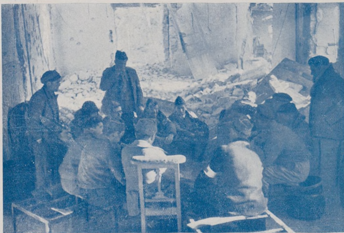
Después de la lucha, un antiguo palacio, ha quedado convertido en ruinas, y sobre estas, nuestros combatientes tal vez hacen proyectos sobre el porvenir de España.

Julio 1936 Al iniciarse el alzamiento militar fascista vemos que el «España» está con ellos, con los asesinatos de la clase trabajadora y por su tradición borbónica bombardea Málaga, Valencia, Cádiz, Santander, asesinando a mujeres y niños indefensos. Pero los que te crearon te maldijeron y das con tus huesos donde tienen que dar todos, en el fondo del mar.