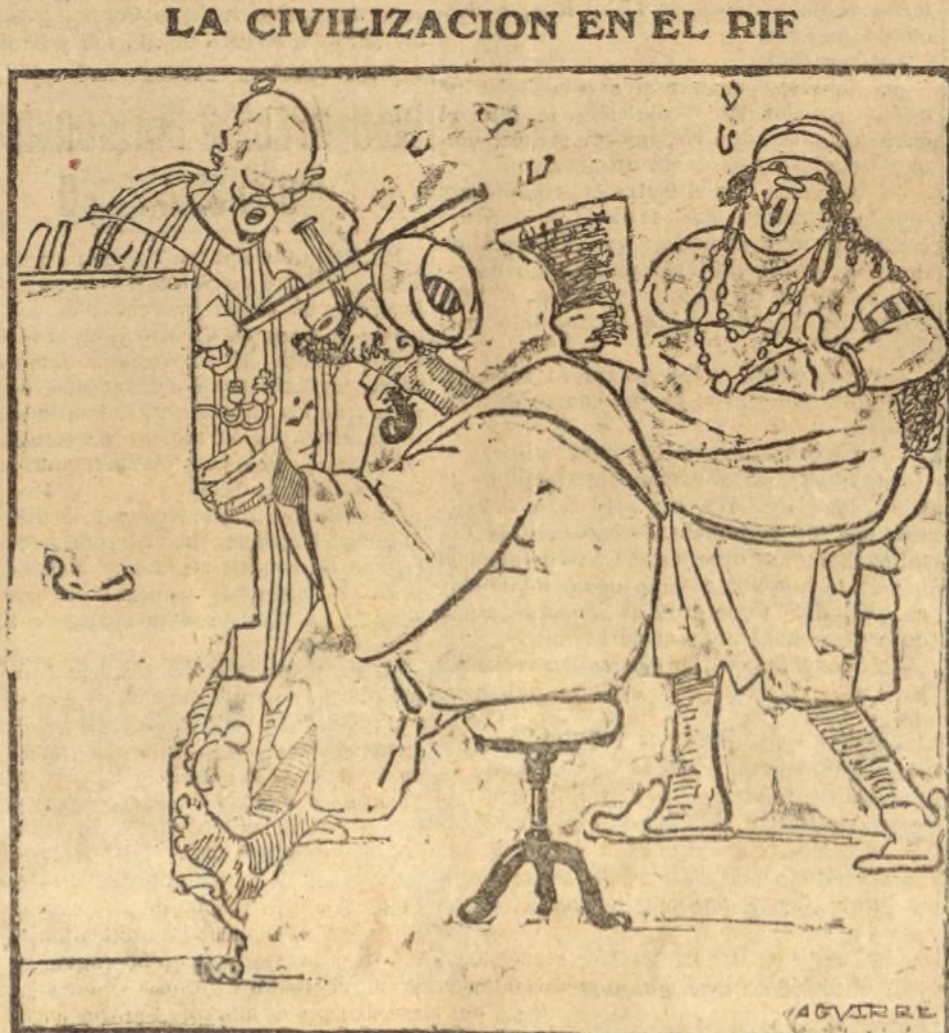
Un concierto de despedida en Nador

El propósito de los aviadores era llegar hasta Argelia en un solo vuelo. Pero se les advirtió que, por si acaso no podían realizar el proyecto, estaban hechos todos los preparativos para que tomasen tierra en el aeródromo de Arbil, de la provincia de Orán.