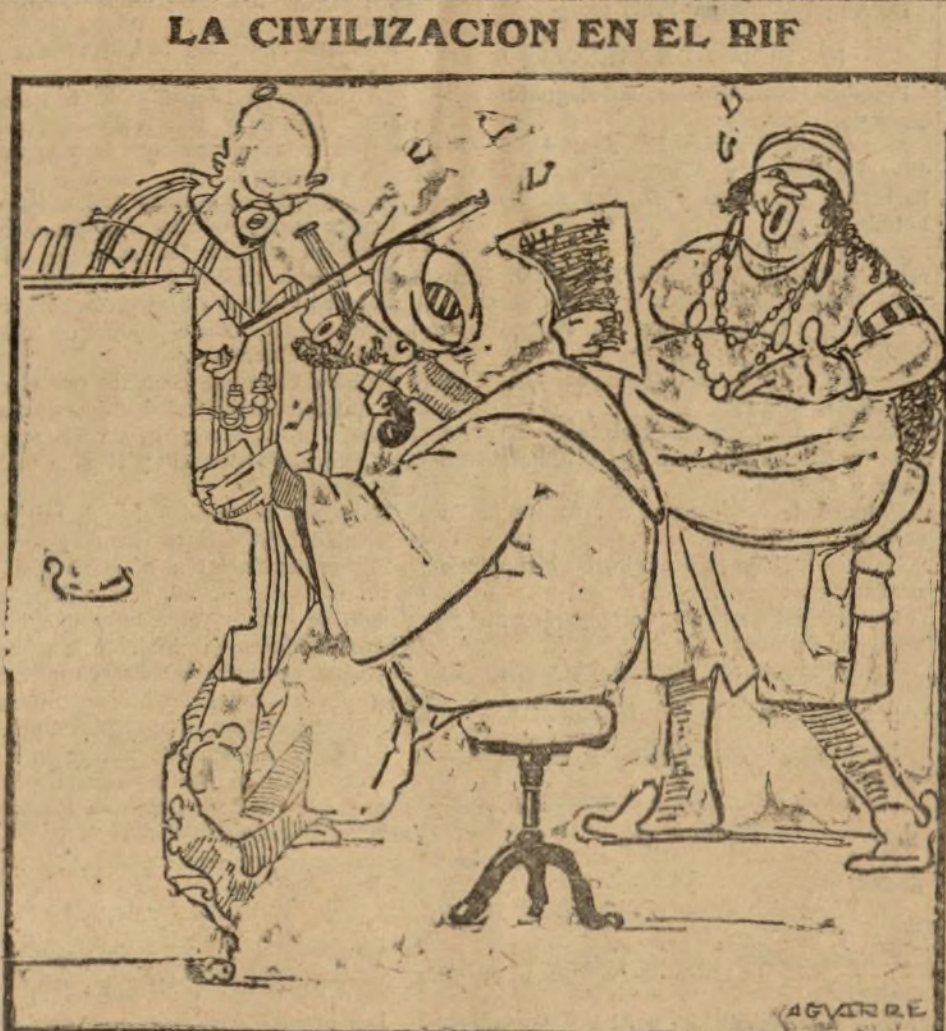
Un concierto de despedida en Nador

El propósito de los aviadores es llegar hasta Argel en un solo vuelo. Pero se les advierte que, por si acaso no podían realizar el proyecto, estaban hechos todos los preparativos para que tomaran tierra en el aeródromo de Armilla, de la provincia de Gra