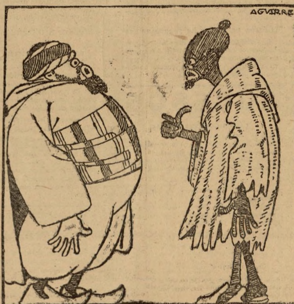
—Después de lo que sabe de Sebt, en Xorfa nos han dado una lección de «arfo».

En el cuartel donde se aloja el regimiento de El Ferrol se ha obsequiado con un «dinner» a los oficiales que marchan a la campaña.