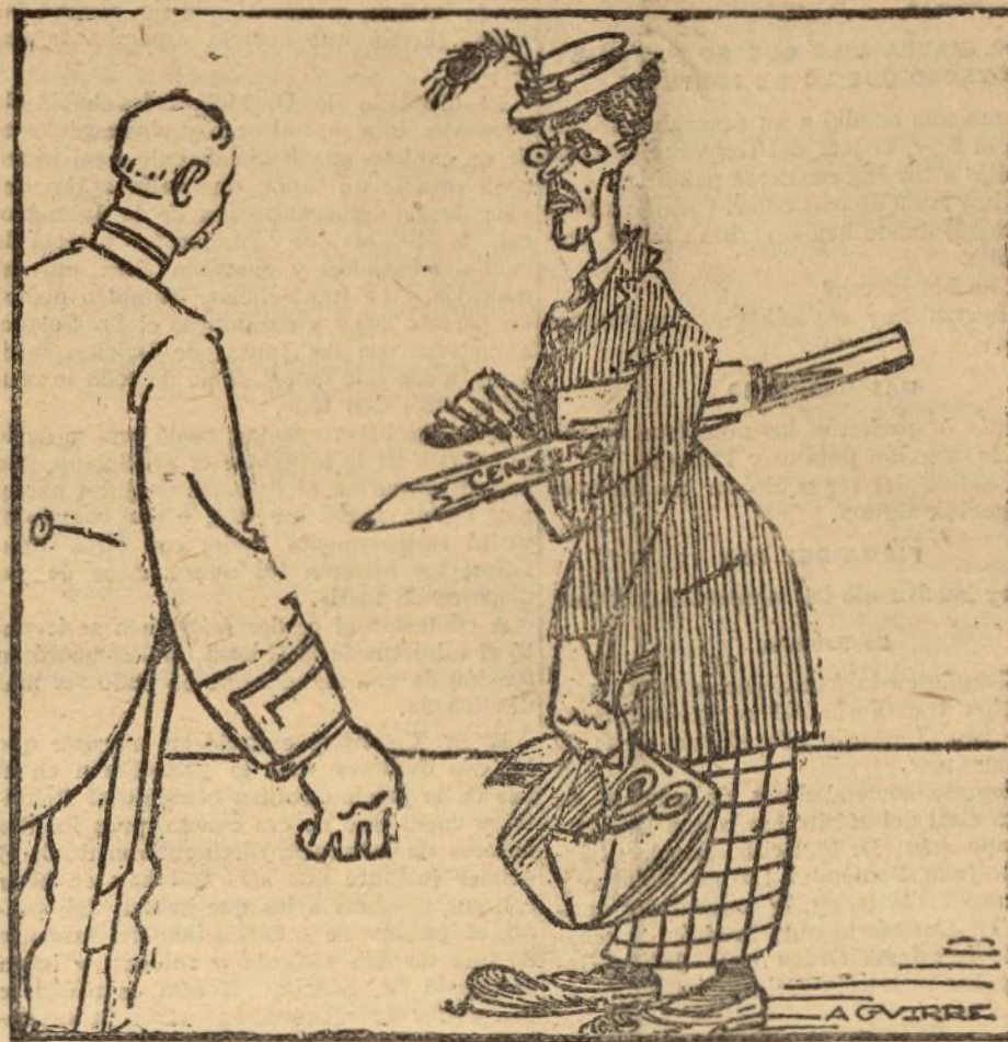
DONA CENSURA.—Haga el favor de decir al Sr. Cierva que espero me llame de un momento a otro.

Señores comandante general de Melilla e interventor civil de Guerra y Marina y del Protectorado en Marruecos.