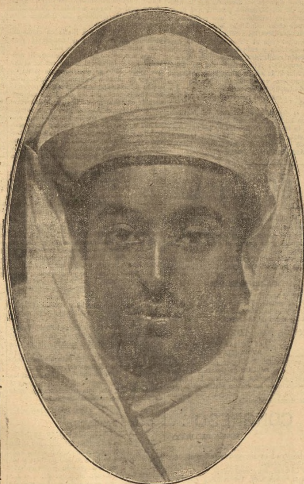
S. A. I. el Jalifa de nuestra zona Muley-el-Mehdi.