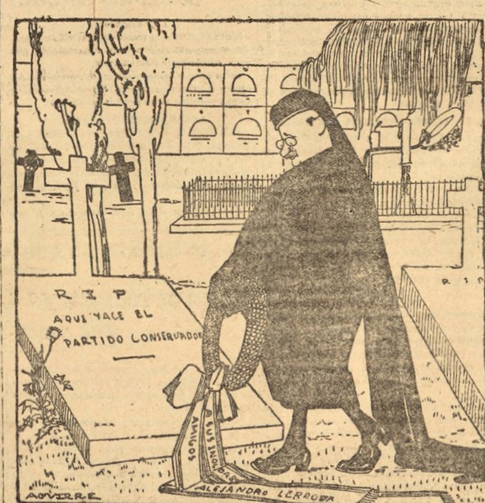
D. ALEJANDRO.—LA QUE SOY YO EL ÚNICO QUE SE ACUERDA DE ESTOS POBRES