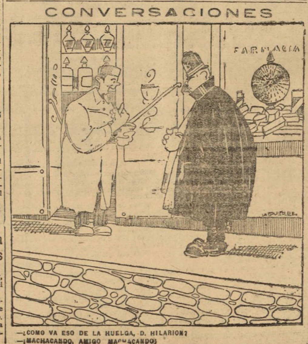
—¿COMO VA ESO DE LA HUELGA, D. HILARION? —¡MACHACANDO, AMIGO MACHACANDO!

Mucho más decente y que habla más en favor del que lo hace es propinarle a su excelencia un par de sonoras bofetadas, agresión más limpia y más en consonancia con el alto rango del agredido, porque no es cierto, aunque lo afirman todos los códigos de honor del mundo, que duele más un saluazo que dos tortas. Moralmente, tal vez; pero lo que se le hace.