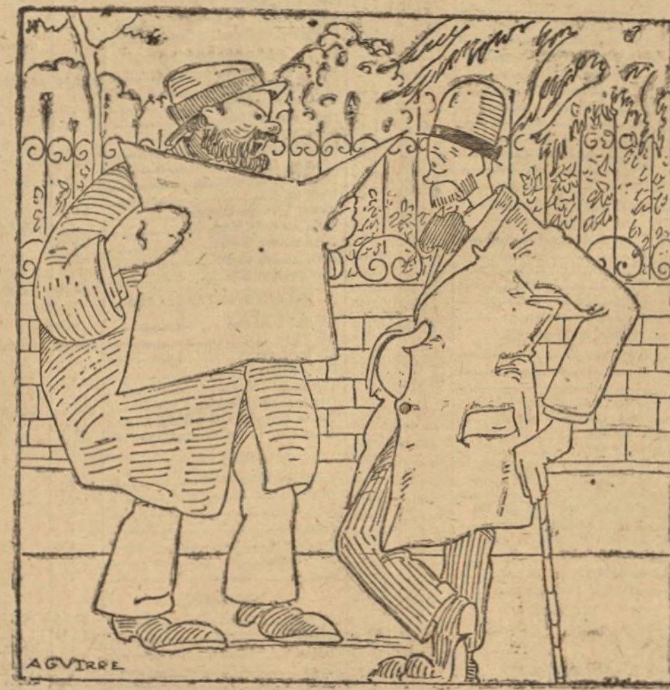
—El marqués de la Viesca quiere enviarnos a los socialistas a Marruecos. —A mí no me vendrá mal la Alta Comisa. la...

Los contingentes de África, mientras no se incorporen a sus respectivos territorios tendrán el mismo haber que los de la península.