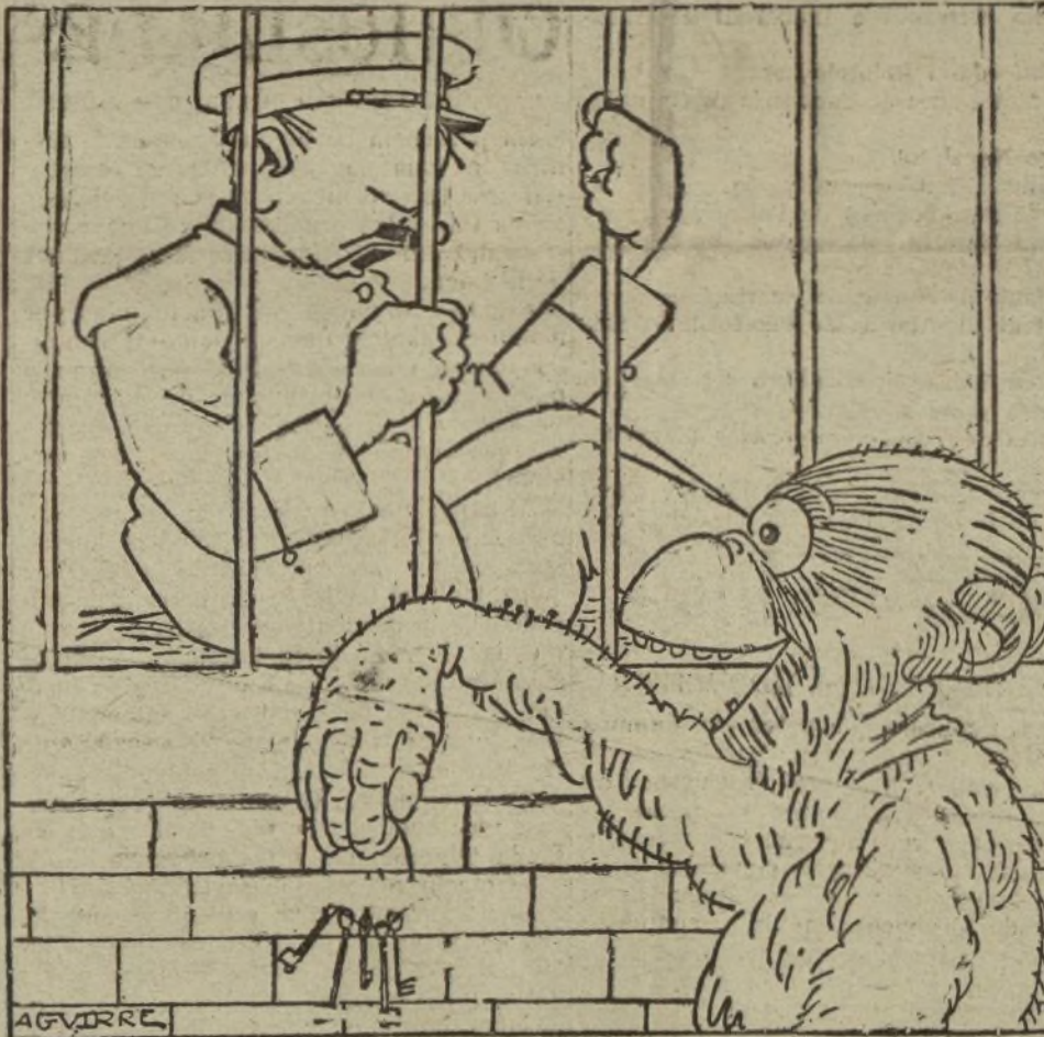
EL MONO.—¡VERAS AHORA COMO SE VAN A REIR LOS CHICOS!