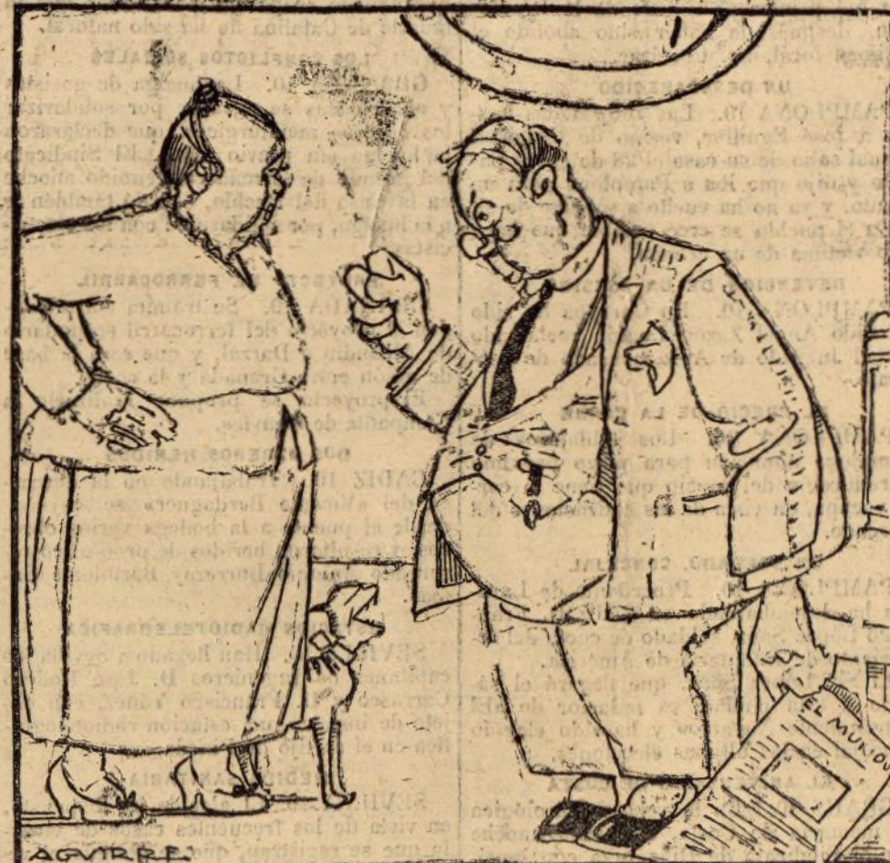
—LOS CONCEJALES QUIEREN TENER AUTOMÓVIL Y YA NO SE CONFORMAN CON ATROPELLARNOS SOLO DESDE EL SALÓN DE SESIONES!..

En primer término habrá de verse si los soviets están dispuestos a dar facilidades comerciales y garantías legales y jurídicas para la protección de la propiedad industrial, literaria y artística, el estatuto consular y la entrada y establecimiento de los extranjeros en Rusia; condiciones todas ellas, sin las cuales el comercio no puede renudarse.