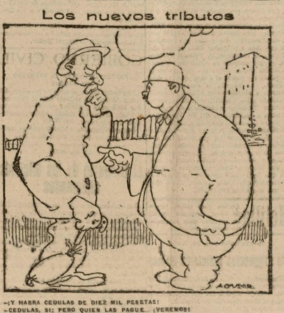
—Y HABRA CEDULAS DE DIEZ MIL PESETAS! —CEDULAS, SI; PERO QUIEN LAS PAGUE... ¿VEREMOS!