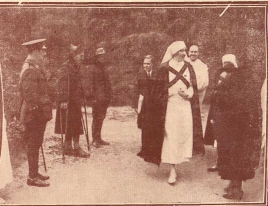
LA REINA RECORRIENDO EL PARQUE DEL HOSPITAL