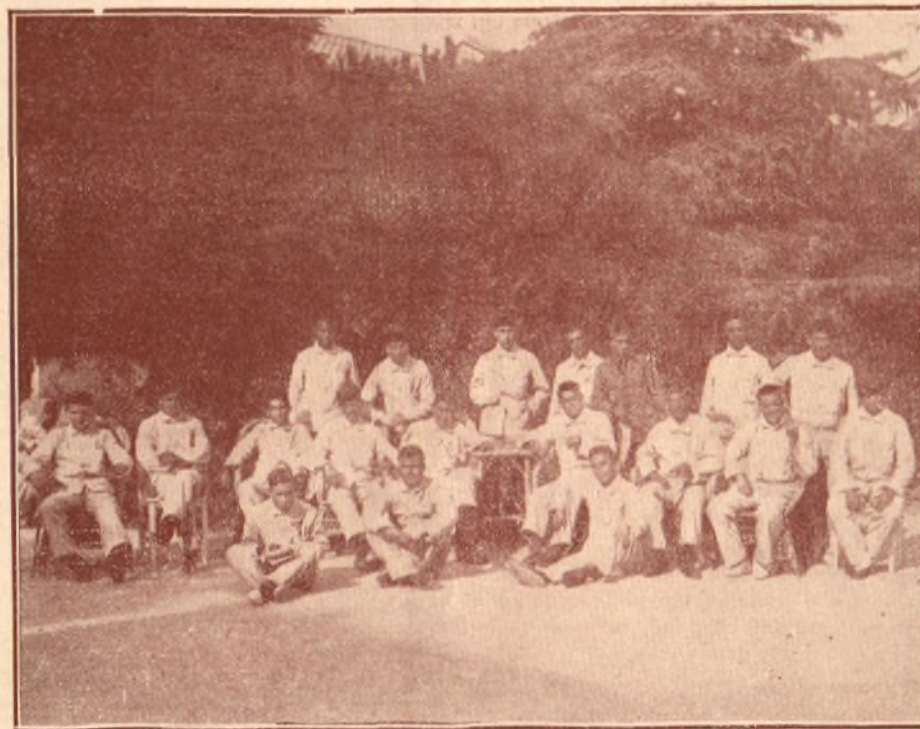
GRUPO DE MILITARES HOSPITALIZADOS

dió esa pátina, se notan los sufrimientos de