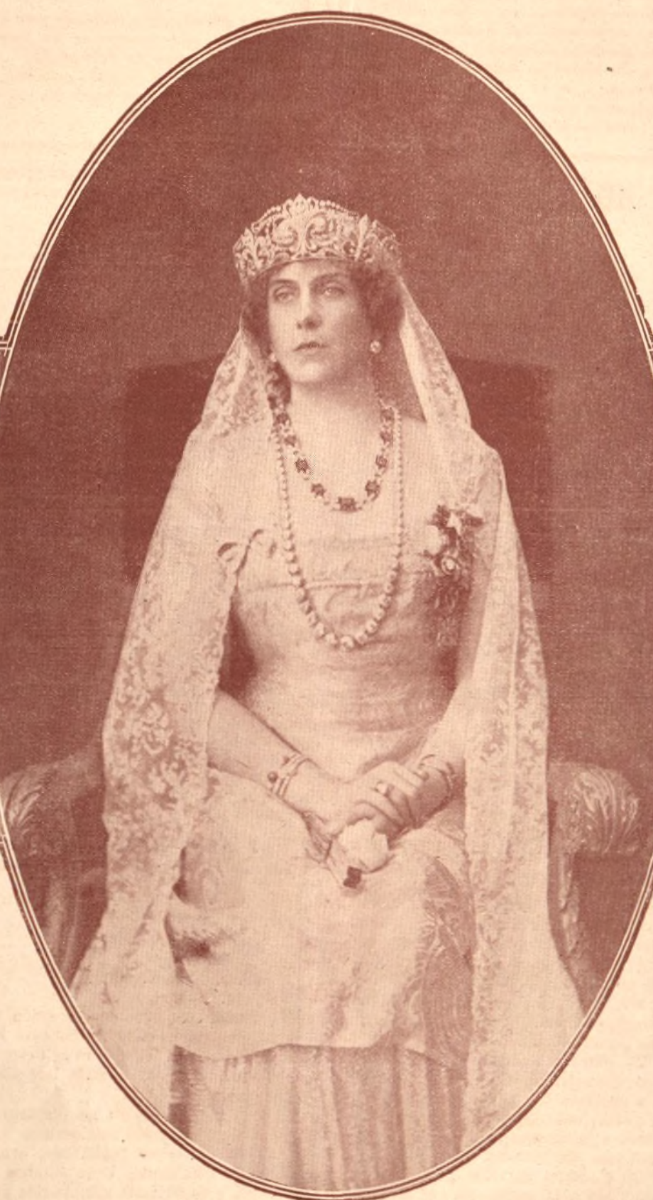
SU MAJESTAD LA REINA DOÑA VICTORIA EUGENIA