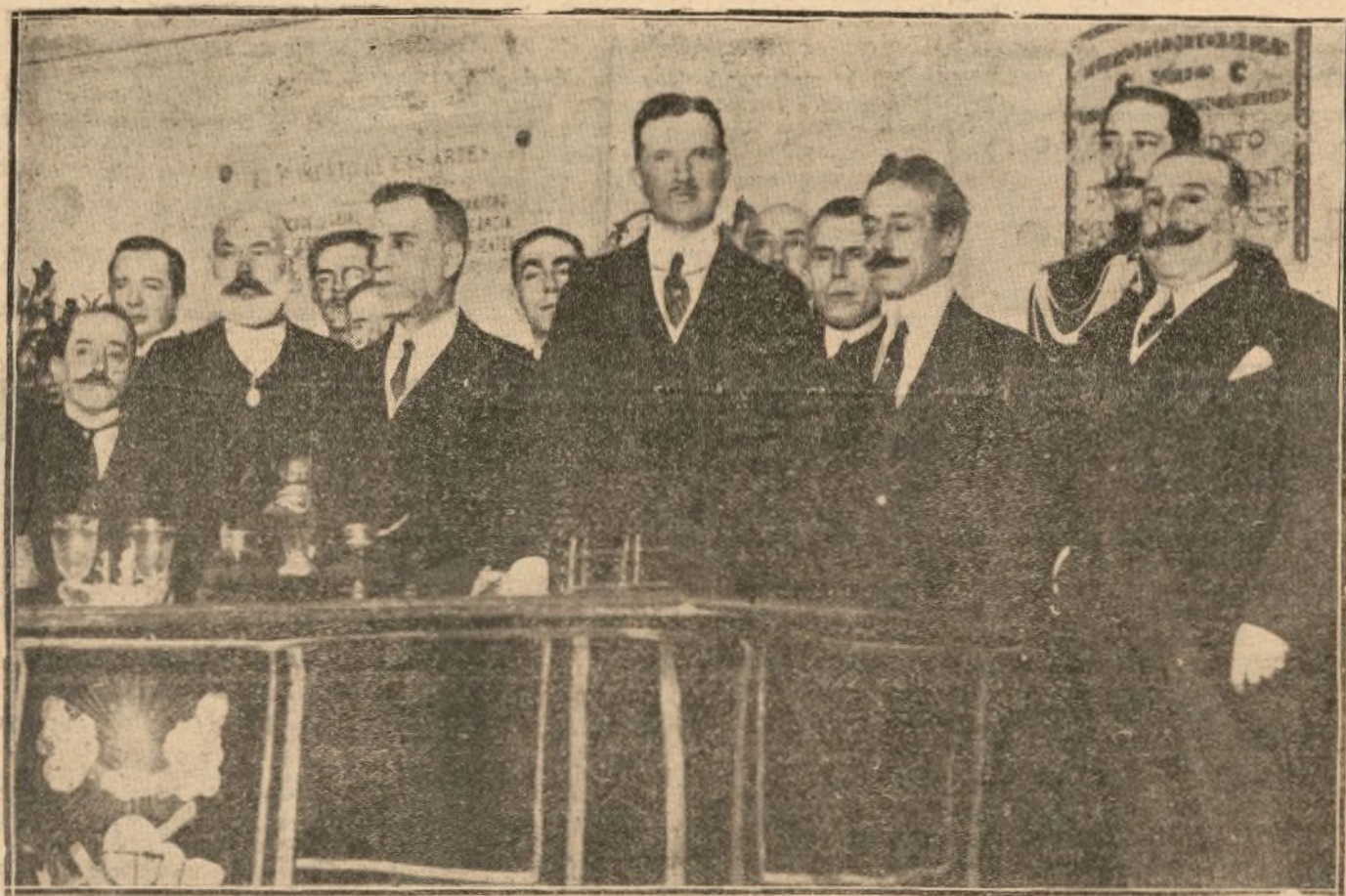
REPARTO DE PREMIOS A LOS ALUMNOS DEL ÚLTIMO CURSO, CON ASISTENCIA DEL INFANTE DON FERNANDO Y MINISTRO DE INSTRUCCION PUBLICA, SEÑOR SILEO (Ret. Pio.)