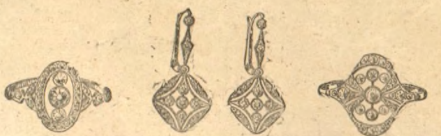
Núm. 2.286.—Sortija con tres brillantes y rosas. Pesetas 605

Casa fundada en 1880. La mejor garantía que existe.