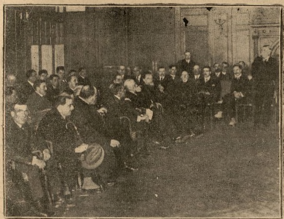
LA ASAMBLEA DE DIPUTADOS Y REPRESENTANTES DE LAS REGIONES VITIVITCOLAS, CELEBRADA AYER EN EL PALACE HOTEL

Durante el bienio que acaba de terminar la hegemonía de los regionalistas fué absoluta, debido a su fuerza numerosa, cohesionada y dúctil sólo a los mandatos de Cambó. Merced a la horregul disciplina de aquella mayoría han sido posibles las curules administrativas que culminaron en la escandalosa concesión de las líneas de autobuses, la compra no menos escandalosa del parque Güell por 3.200.000 pesetas, a pesar de haberse demostrado que su valor no excede de un millón de pesetas, y el reconocimiento de propiedad de los terrenos de la plaza de Cataluña.